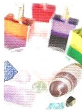
より深い癒しや、 内面で湧き出している 感情を解放したい方、 マインドフルネスや ヒーリングセラピーが おすすめです